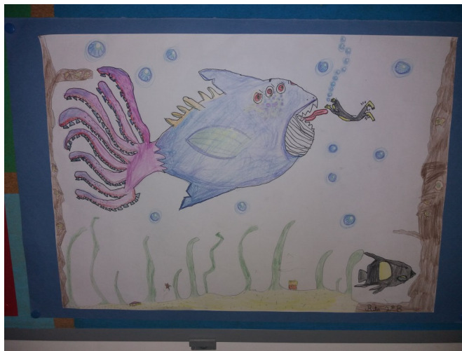
Criatura marinha – Desenho dos alunos da turma 2.ºB.