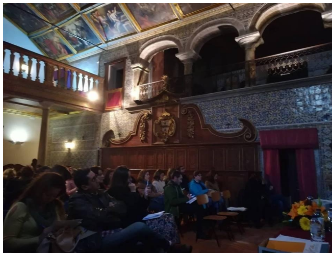
Momento de formação na Igreja da Misericórdia de Peniche.