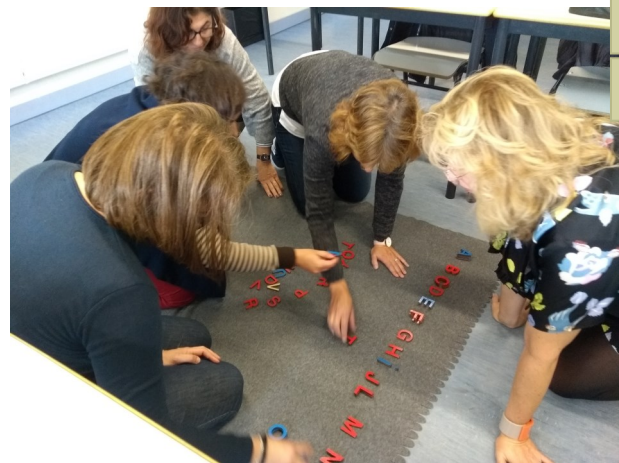
Formandos em atividade ( workshop “Pedagogia Montessori”).

- “A forma como decorreu o workshop foi, no meu parecer, corretamente orientada dando-nos a possibilidade de aprender, refletir e perceber como tudo começou, dando sentido à prática”.