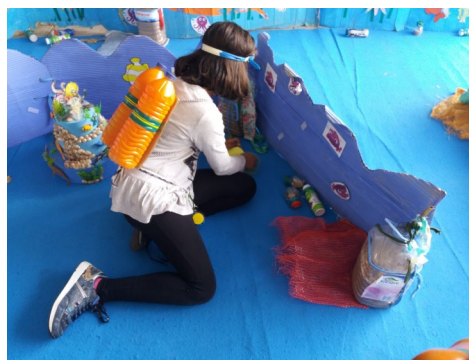
Jogos salvem os Oceanos — Dia do Mar, EB da Carvoeira.

Municipal de Mafra, criar a disciplina Oceanos. Não se pretende que esta seja mais uma disciplina curricular com conteúdos específicos. Antes, que seja o mote para um mergulho num mar de conhecimento inteiramente por descobrir. Os alunos são desafiados, desde o 1.º ano, a construir os seus próprios projetos sobre a temática dos Oceanos, partindo do que já sabem, são desafiados a questionar-se e a querer saber mais, a procurar conhecimento, mas também a propor soluções. Temáticas como o Desenvolvimento Sustentável ou a Educação Ambiental, previstas na Estratégia Nacional de Educação para a Cidadania, enquanto componente transversal do currículo são concretizadas nestes projetos, permitindo simultaneamente abordar Aprendizagens Essenciais previstas para o Estudo do Meio, a Educação Artística ou qualquer uma das disciplinas curriculares de base. As TIC, pela sua natureza instrumental, são nestes projetos um recurso a explorar e potenciar mobilizando a natureza digital das novas gerações.